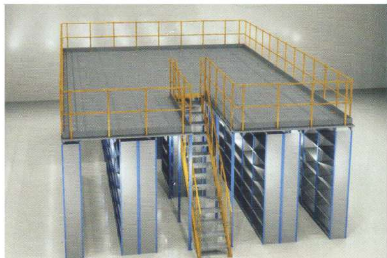
Plate-forme à niveau uni sur une installation de stockage.

optimiser l'aménagement de votre espace, vous permettant l'exploitation sur mesure du haut vers le bas de votre surface sans avoir à construire à nouveau !