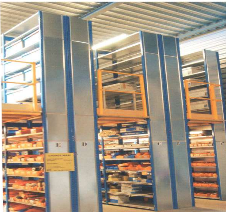
Plate-forme avec allée de circulation pour optimiser la hauteur et le volume de stockage