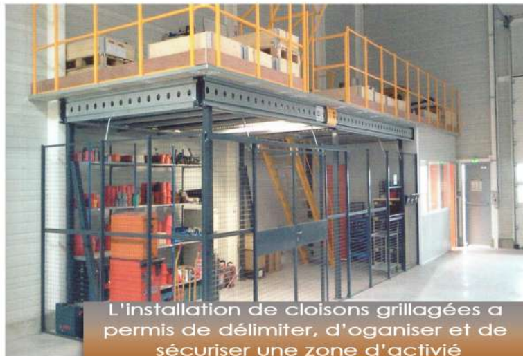
L'installation de cloisons grillagées a permis de délimiter, d'organiser et de sécuriser une zone d'activité