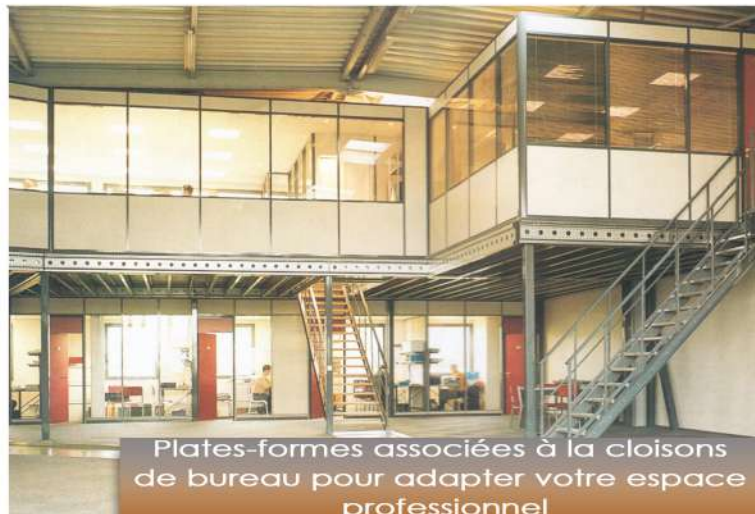
Plates-formes associées à la cloisons de bureau pour adapter votre espace professionnel